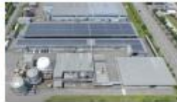
富山グリーンフードリサイクル