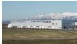
砂川地区保健衛生組合商業物循環型 社会基盤施設砂川クリーンプラザ