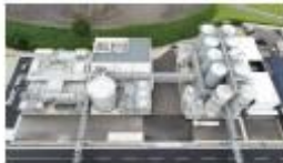
静岡酒造 志比田焼酎粕 リサイクル施設