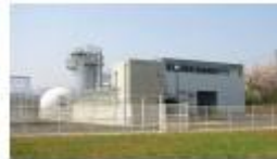
白石市生ごみ資源化事業所 シリウス